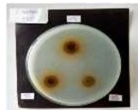
Gambar 2 Hasil zona hambat kontrol positif ekstrak daun salam ( Syzygium polyanthum ) konsentrasi 50%, 75% dan 100% terhadap bakteri Streptococcus mutans .