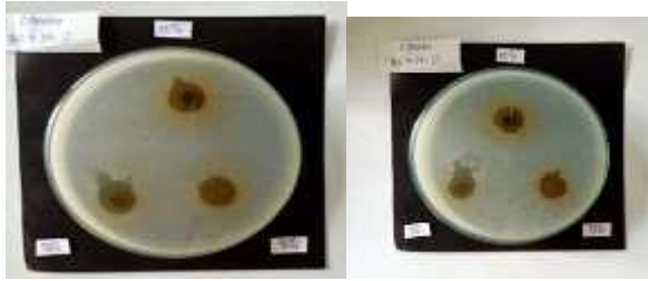
Gambar 3 Hasil zona hambat pada ekstrak daun salam ( Syzygium polyanthum ) konsentrasi 50%, 75% dan 100% - kitosan nanopartikel 1% terhadap bakteri Streptococcus mutans .

Selanjutnya, dilakukan analisa data menggunakan uji korelasi Pearson , hasil pengukuran uji korelasi Pearson selengkapnya dapat di perhatikan pada tabel 5 di bawah ini.