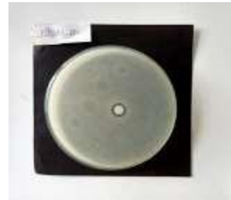
Gambar 1 Hasil zona hambat kontrol positif Kitosan nanopartikel 1% terhadap bakteri Streptococcus mutans .

Berdasarkan data uji statistik one way ANOVA pada tabel 4 diatas menunjukkan bahwasanya hasil signifikansi p=0,000 (p<0,05). Berdasarkan hasil ini terdapat efek antibakteri nanopartikel kitosan 1% dan ekstrak daun salam ( Syzygium polyanthum ) terhadap perkembangan bakteri Streptococcus mutans .