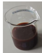
Gambar 1. Hasil maserasi bunga melati

Bunga melati sebanyak 250 gram ditambahkan etanol sebanyak 500 mL kemudian ditutup rapat dan disimpan di ruang gelap selama 1 minggu. Setelah 1 minggu, filtrate bunga melati diambil dan residu dibuang. Filtrate ini digunakan untuk pengujian senyawa metabolit sekunder.