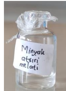
Gambar 3. Hasil isolasi minyak atsiri bunga melati

dalam erlenmeyer. Setelah itu dilakukan pemisahan minyak atsiri dan aquadest yang tertampung dalam erlenmeyer. Pemisahan ini dilakukan menggunakan corong pisah dengan penambahan Na 2 SO 4 anhidrat, dimana Na 2 SO 4 anhidrat berfungsi untuk mengikat air yang ikut masuk ke dalam erlenmeyer pada saat proses destilasi sehingga akan didapatkan minyak atsiri murni. Setelah itu hasil minyak atsiri ditimbang dan dihitung % rendemen. Hasil rendemen bunga melati yaitu 2,0602%