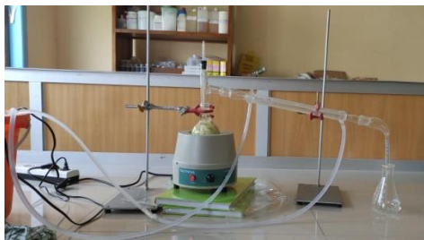
Gambar 2. Proses isolasi minyak atsiri bunga melati dengan metode destilasi air

Dari tabel 1 dapat disimpulkan bahwa bunga melati memiliki kandungan alkaloid, flavonoid, saponin, steroid/terpenoid.