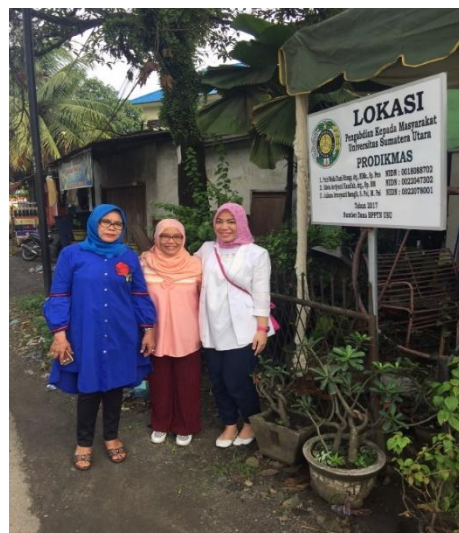
Gambar 6. Ketua program pengabdian masyarakat berfoto di depan plang pengabdian masyarakat pada mitra 2 (posyandu lansia bougenville titi kuning)