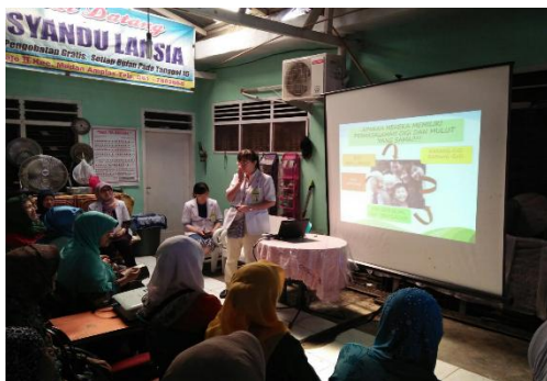
Gambar 2. Penyuluhan dari Tim Prostodonsia

Tahap dua dilakukan pakar dari prostodonsia, psikologi dan bedah mulut. Prosedur untuk pakar prostodonsia adalah dilakukan penyuluhan tentang akibat dan perawatan gigi yang hilang dan prosedur untuk pakar psikologi adalah dilakukan penyuluhan untuk menguatkan motivasi dan minat lansia untuk memakai gigi tiruan. Prosedur untuk pakar bedah mulut adalah pemeriksaan dan diagnosa, pengukuran tekanan darah pasien, sterilisasi alat dan persiapan bahan, anastesi pleksus/smia, pengungkitan gigi dengan bein, pengambilan gigi dengan tang yang sesuai dengan regio gigi, penghalusan tulang dengan bone file, spooling dengan povidone iodine 10%, pemberian tampon, instruksi pasca bedah, pemberian resep obat.