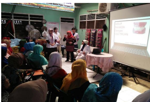
Gambar 3. Penyuluhan dari Tim Psikologi

Tahap ketiga dilakukan oleh pakar prostodonsia dan psikologi. Prosedur yang dilakukan adalah pencetakan anatomis (pencetakan pertama), pembuatan model rahang atas dan bawah, serta pembuatan sendok cetak fisiologis; muscle trimming , pencetakan fisiologis (pencetakan kedua), pembuatan model fisiologis, pembuatan desain gigi tiruan; pembuatan basis gigi tiruan, pengukuran dimensi vertikal, pemilihan dan penyusunan anasir gigi tiruan anterior rahang atas dan bawah; penyusunan anasir gigi tiruan posterior rahang atas dan bawah; pembuatan gigi tiruan, penyelesaian akhir; pemasangan gigi tiruan; kontrol pasca pemasangan dan evaluasi dengan kuesioner menggunakan skala likert.