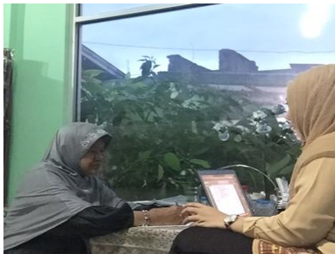
Gambar 1. Ketua Program Pengabdian Masyarakat melakukan peninjauan ke mitra 1

lansia yang membutuhkan perawatan rongga mulut dan pembuatan gigi tiruan, serta membagikan kuesioner awal untuk mengetahui kondisi psikologi lansia menggunakan skala likert. 9