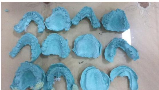
Gambar 8. Beberapa Model rongga mulut yang didapat dari pencetakan kader di dua posyandu lansia