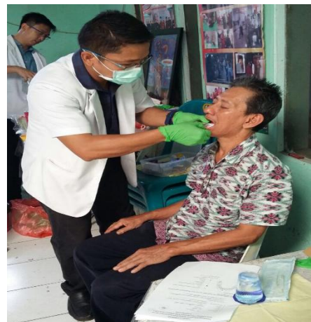
Gambar 4. Pencetakan anatomis yang dilakukan oleh tim kepada salah satu kader

Tahap ketiga dilakukan oleh pakar prostodonsia dan psikologi. Prosedur yang dilakukan adalah pencetakan anatomis (pencetakan pertama), pembuatan model rahang atas dan bawah, serta pembuatan sendok cetak fisiologis; muscle trimming , pencetakan fisiologis (pencetakan kedua), pembuatan model fisiologis, pembuatan desain gigi tiruan; pembuatan basis gigi tiruan, pengukuran dimensi vertikal, pemilihan dan penyusunan anasir gigi tiruan anterior rahang atas dan bawah; penyusunan anasir gigi tiruan posterior rahang atas dan bawah; pembuatan gigi tiruan, penyelesaian akhir; pemasangan gigi tiruan; kontrol pasca pemasangan dan evaluasi dengan kuesioner menggunakan skala likert.