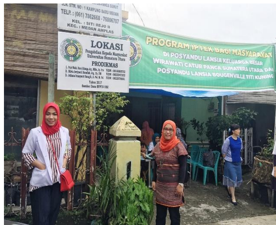
Gambar 5. Ketua program pengabdian masyarakat berfoto di depan plang pengabdian masyarakat pada mitra 1 (posyandu lansia keluarga besar wirawati catur panca sumatera utara)