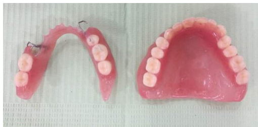
Gambar 9. Gigi tiruan sebelum dipasang