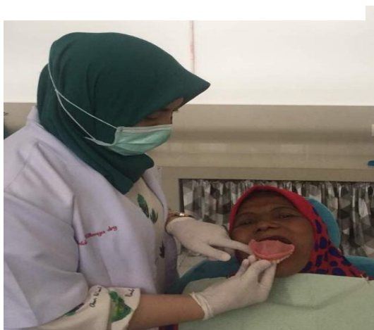
Gambar 10. Pemasangan gigi tiruan penuh kepada salah satu kader posyandu lansia di FKG USU